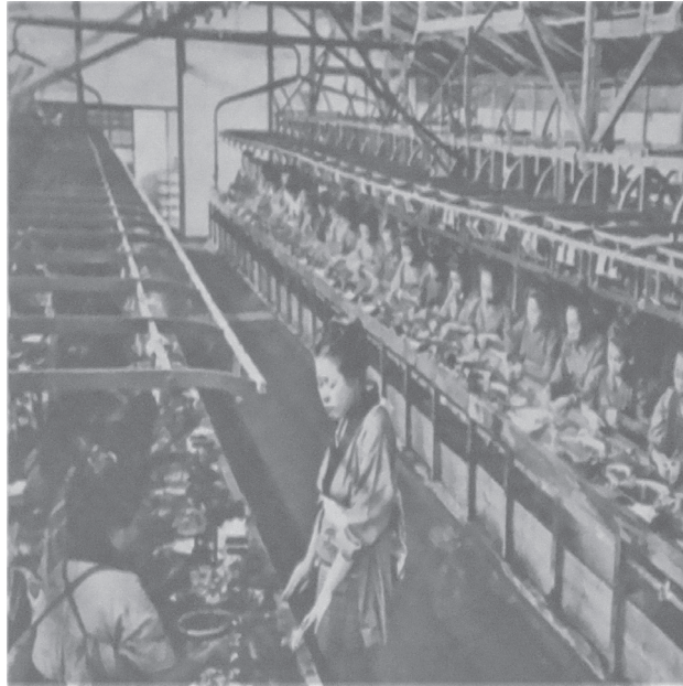
資料3-2 「明治期日本の紡績工場での女工の労働風景（写真）」